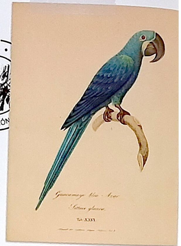
Ilustración antigua

Eduardo L. Holmberg la consideró ya una especie muy rara. Las poblaciones de este animal despidieron el siglo XIX enrarecidas, ya para desvanecerse por completo en el próximo. Darwin había profetizado algo genérico y contundente sobre esto: “la rareza precede a la extinción”.